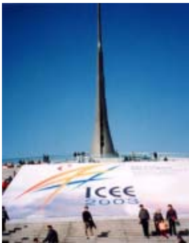
(左)ICEE の会場である北京中華世紀壇

E-touch では携帯電話向けに来春配信予定のドライビングゲームを中心にコンテンツラインナップを紹介しました。