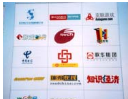
(右)様々なコンテンツ事業者が出展しました。