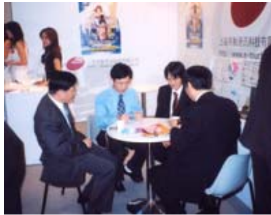
(右)ブース内での商談風景