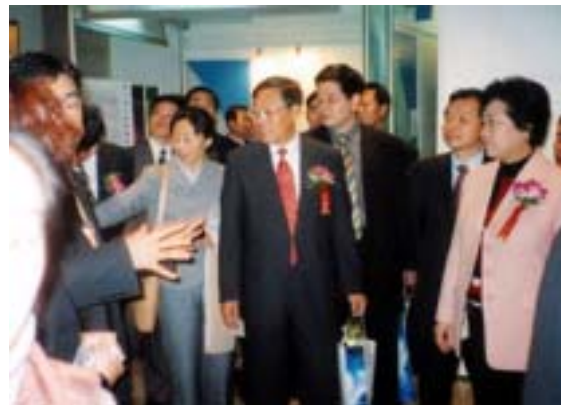
(右)海外出展ブース代表として北京市長の表敬訪問を受けました。