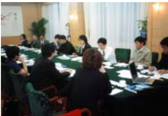
(上)中国の大手 ICP である空中網をゲストに迎えセミナーを開きました。

今回の ICEE2003 が第一回目の開催ということもあり、国内外からの注目度も高く、よりよいプロモーションの場でありました。加えて中国国内の市場規模や海外企業の進出の状況など肌で感じることの出来たよい機会でした。